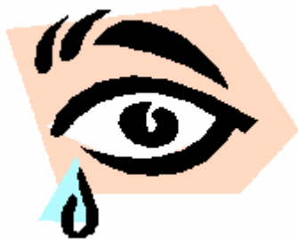
Gouttes pour les yeux