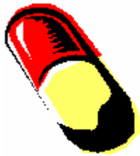
Gélules pour la gorge.