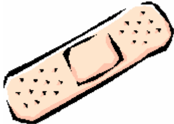
Sparadrap - pansement