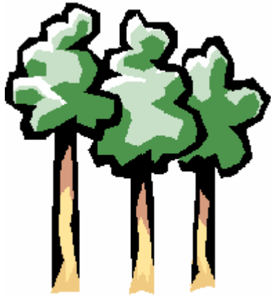
une forêt de hêtres