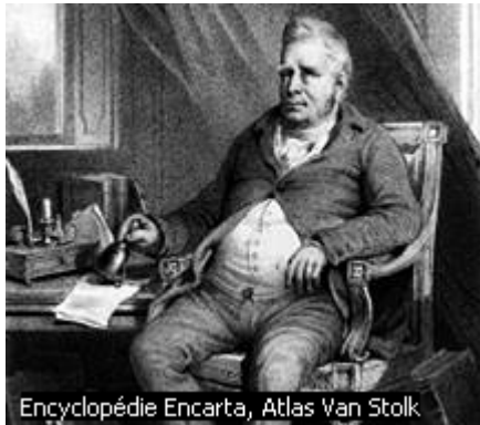
Encyclopédie Encarta, Atlas Van Stolk

Autrefois, la Belgique n'existait pas. Elle n'était pas un pays indépendant : elle était sous l'autorité espagnole, autrichienne, française puis, enfin, hollandaise.