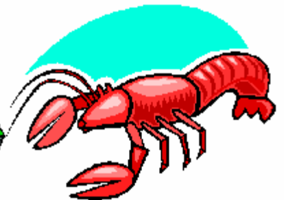
palace, auberge, buffet