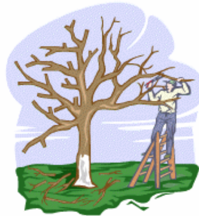
On élague les arbres.