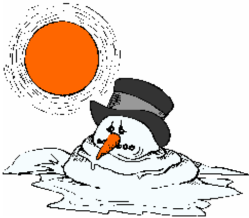
La neige fond.

Que se passe-t-il au mois de mars ? C'est le PRINTEMPS !