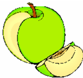
le quartier de pomme