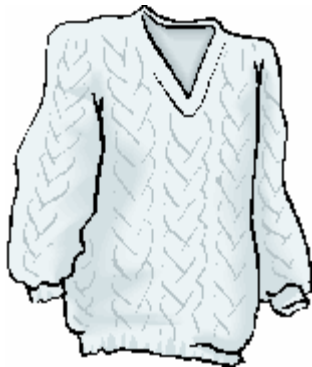
une blouse blanche