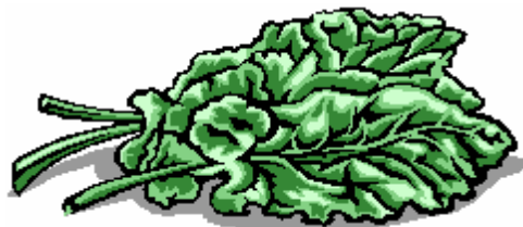
La blette contient du fer.