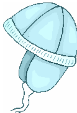
un bonnet bleu