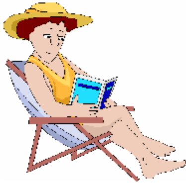
Elle lit, assise dans un transat.