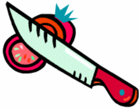
Couper une tranche