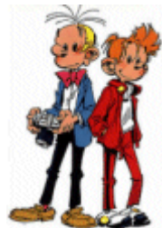
Spirou et Fantasio