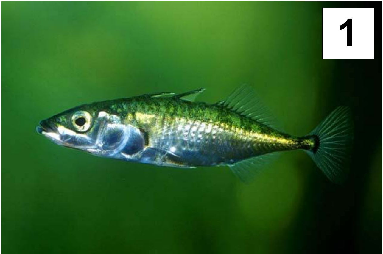
A afficher au tableau. NB : ces photos sont des épinoches de deux espèces différentes.