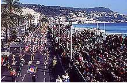
Le carnaval de Nice

Le carnaval de Nice – Le carnaval de Venise – Le carnaval à la Martinique