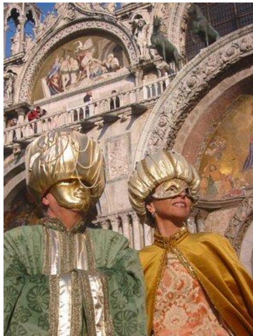
Le carnaval de Venise